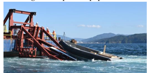
図4 揚収試験 Fig.4 Recovery test