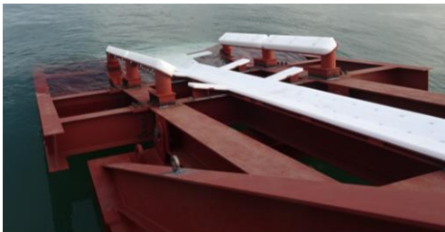
図1 艦尾扉スリップウェイ部 Fig.1 Stern Ramp

艦尾の搭載艇格納区画を閉鎖するための扉であるが、下開き式とし、投入および揚収時に特殊樹脂で成形されたスリップウェイを介して搭載艇を滑降させる。