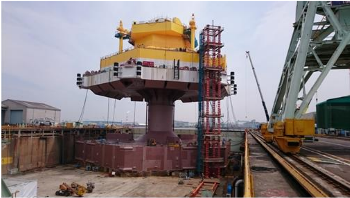
日立造船殿ドック内